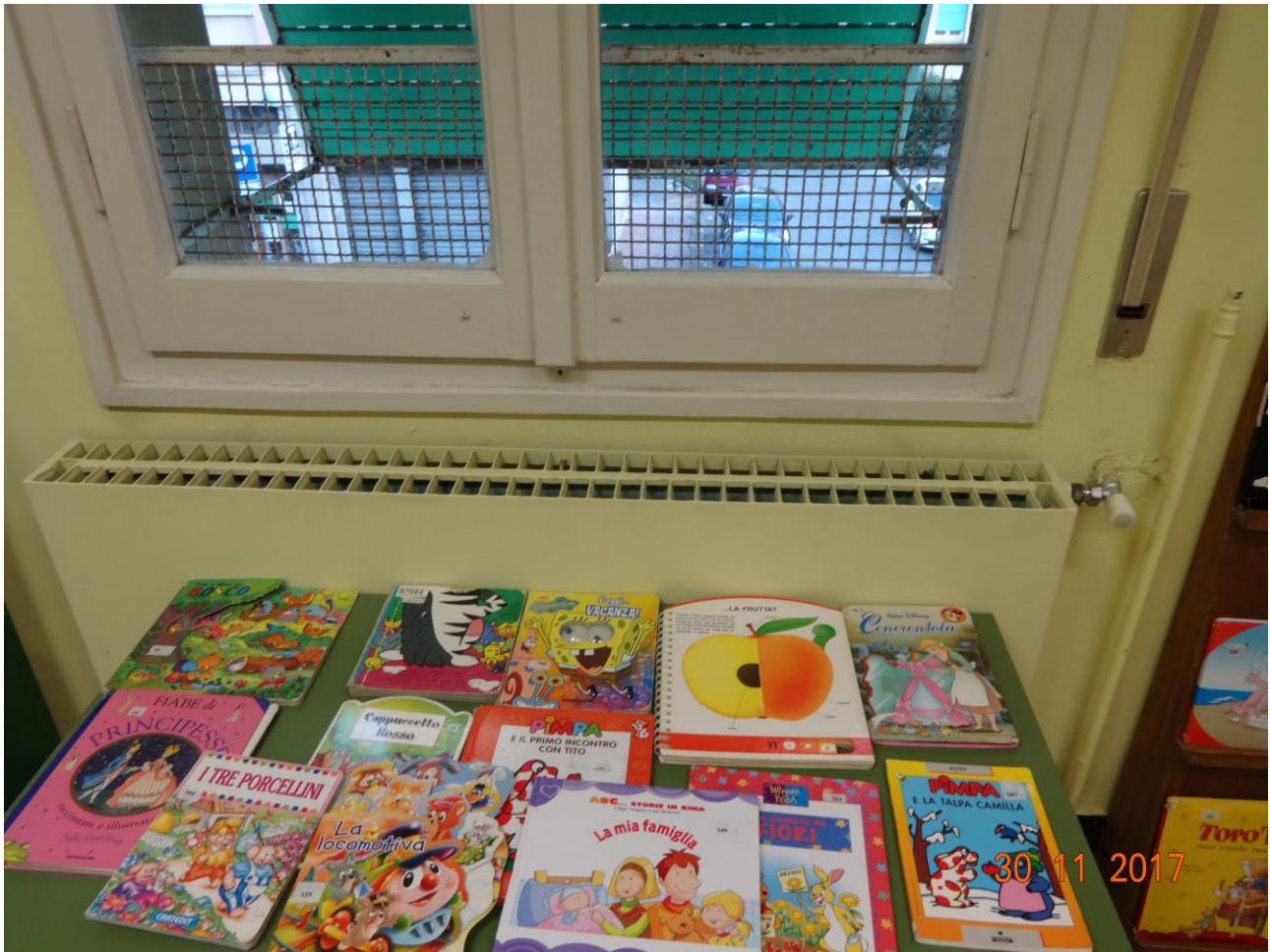
Figura 16 ALLEGATO B_Lotto.6 – E0761_foto16