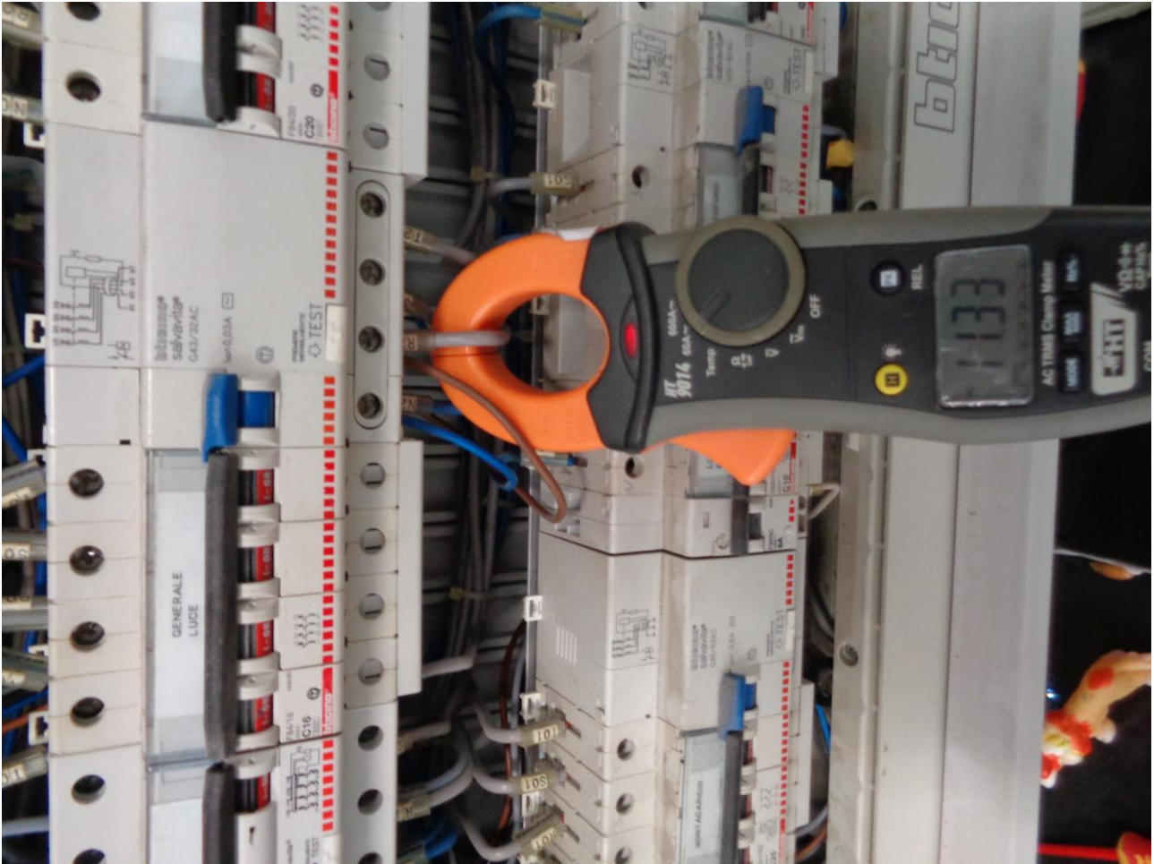
Figura 12 ALLEGATO B_Lotto.6 – E0761_foto12