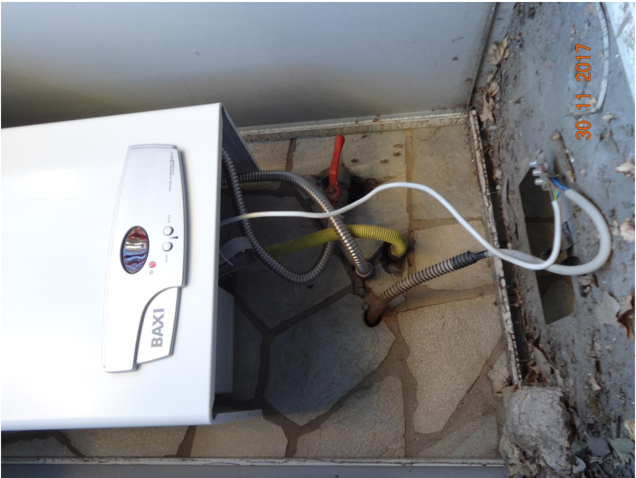
Figura 10 ALLEGATO B_Lotto.6 – E0761_foto10