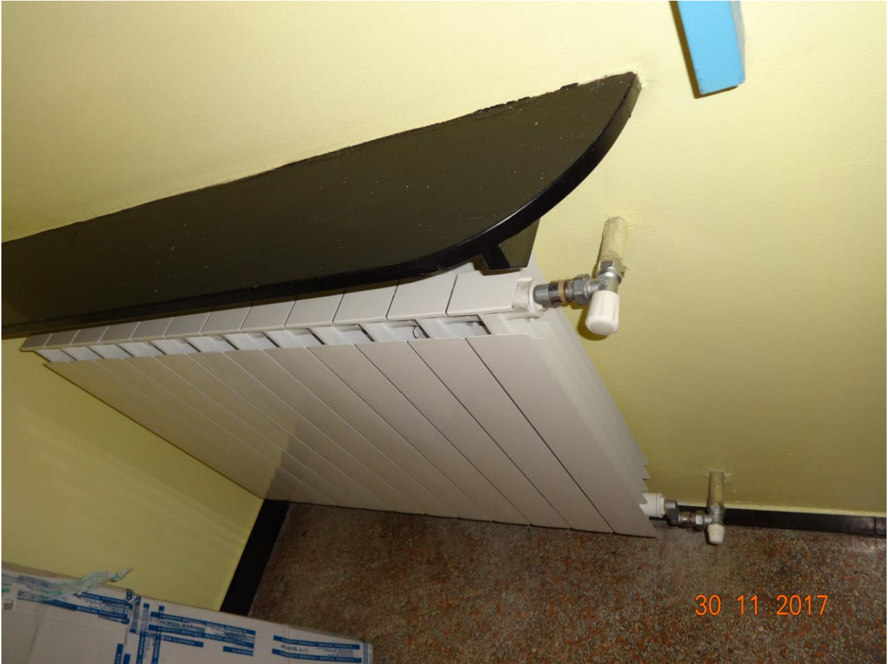
Figura 5 ALLEGATO B_Lotto.6 – E0761_foto5