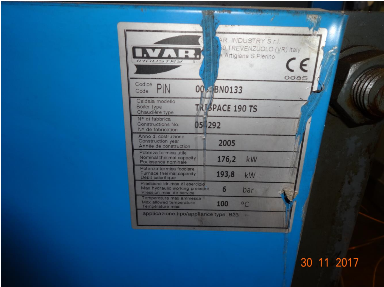
Figura 8 ALLEGATO B_Lotto.6 – E0761_foto8