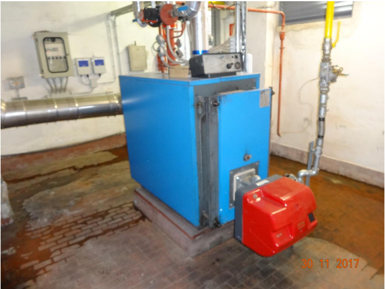
Figura 7 ALLEGATO B_Lotto.6 – E0761_foto7