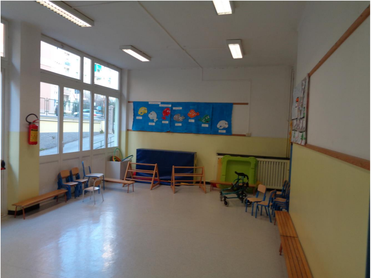
Figura 14 ALLEGATO B_Lotto.6 – E0761_foto14