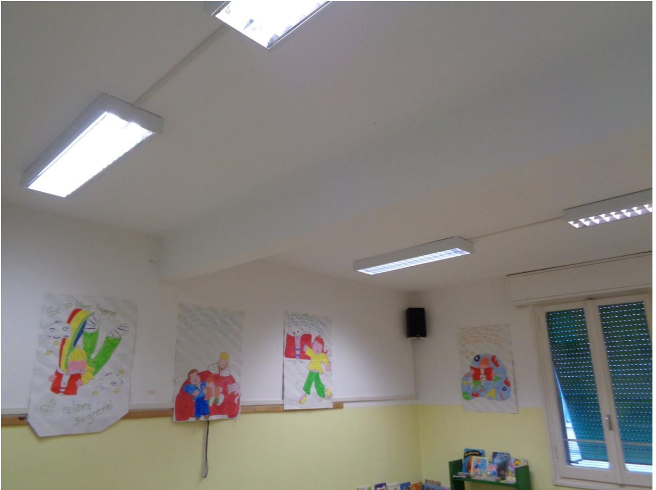
Figura 13 ALLEGATO B_Lotto.6 – E0761_foto13