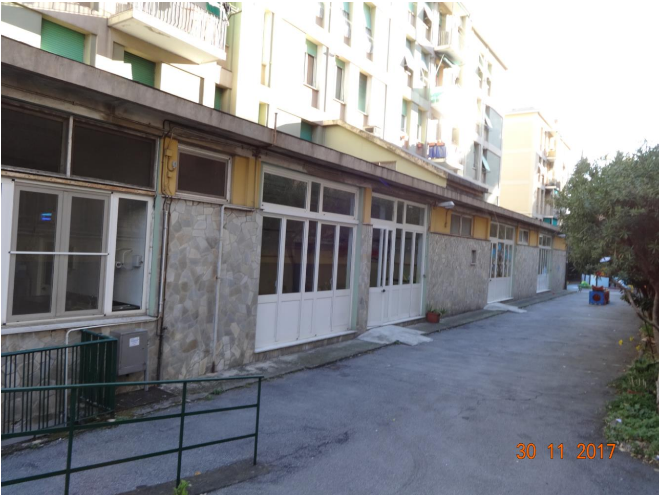
Figura 2 ALLEGATO B_Lotto.6 – E0761_foto2