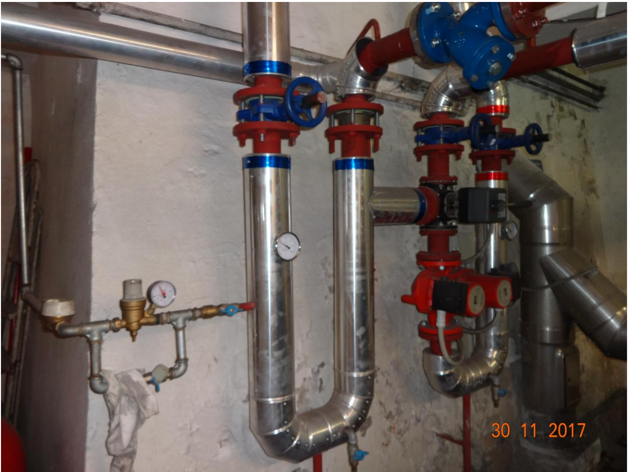
Figura 6 ALLEGATO B_Lotto.6 – E0761_foto6