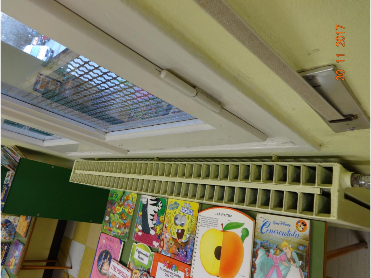
Figura 3 ALLEGATO B_Lotto.6 – E0761_foto3