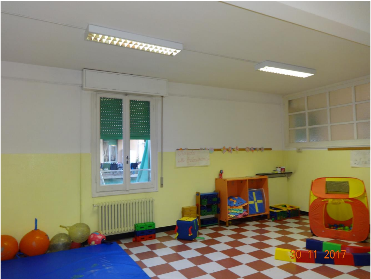
Figura 4 ALLEGATO B_Lotto.6 – E0761_foto4