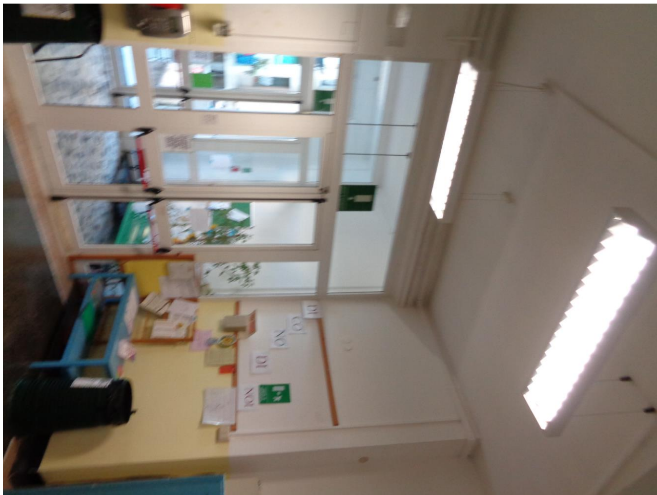
Figura 15 ALLEGATO B_Lotto.6 – E0761_foto15