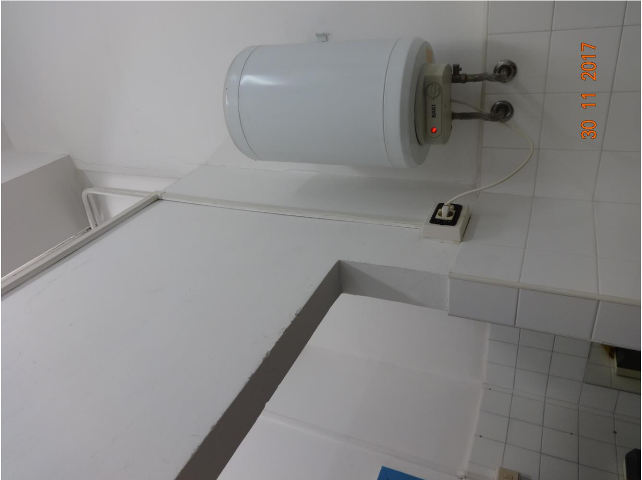
Figura 9 ALLEGATO B_Lotto.6 – E0761_foto9