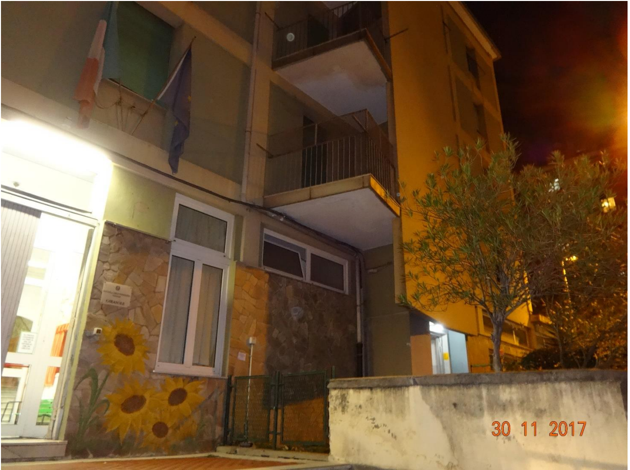
Figura 1 ALLEGATO B_Lotto.6 – E0761_foto1